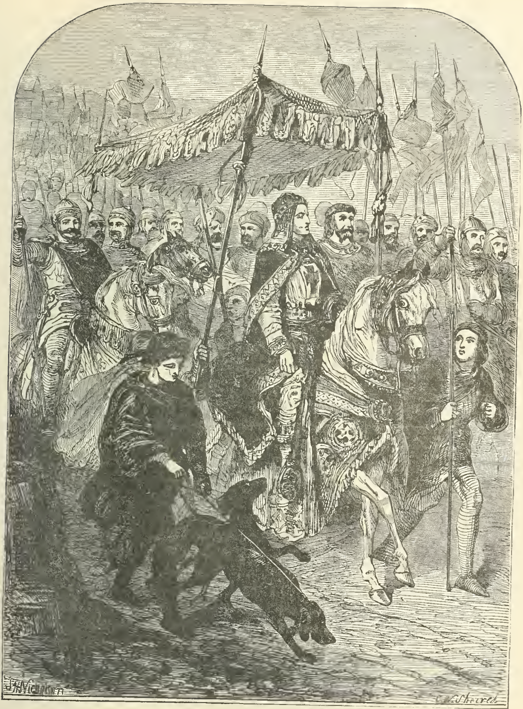
Passage de Thomas Becket à travers la France. (page 251)